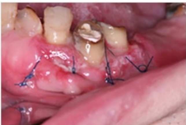
クラウンレングス